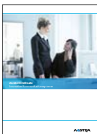
Aastra IntelliGate Innovative kommunikationssystemer