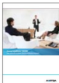
Aastra IntelliGate 150/300 Det fremtidssikrede kommunikationssystem