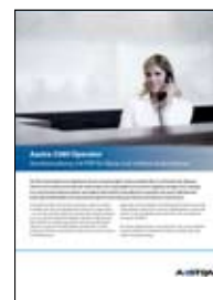
Aastra 5380 Pc-omstilling